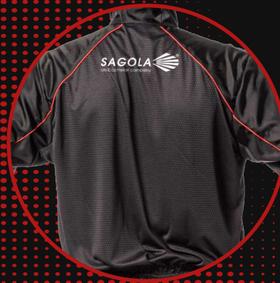
Tissu dorsal respirant, sous les bras et à l'entrejambe

Poche poitrine avec rabat de protection et fermeture velcro. 2 poches latérales pour les mains avec bande de protection et fermeture velcro. Poche arrière. Poignets confortables en nylon et ceinture élastiquée à la cheville.