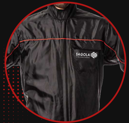
Fermeture à glissière et poches

Tissu antistatique conforme à la norme EN 1149-1:2006